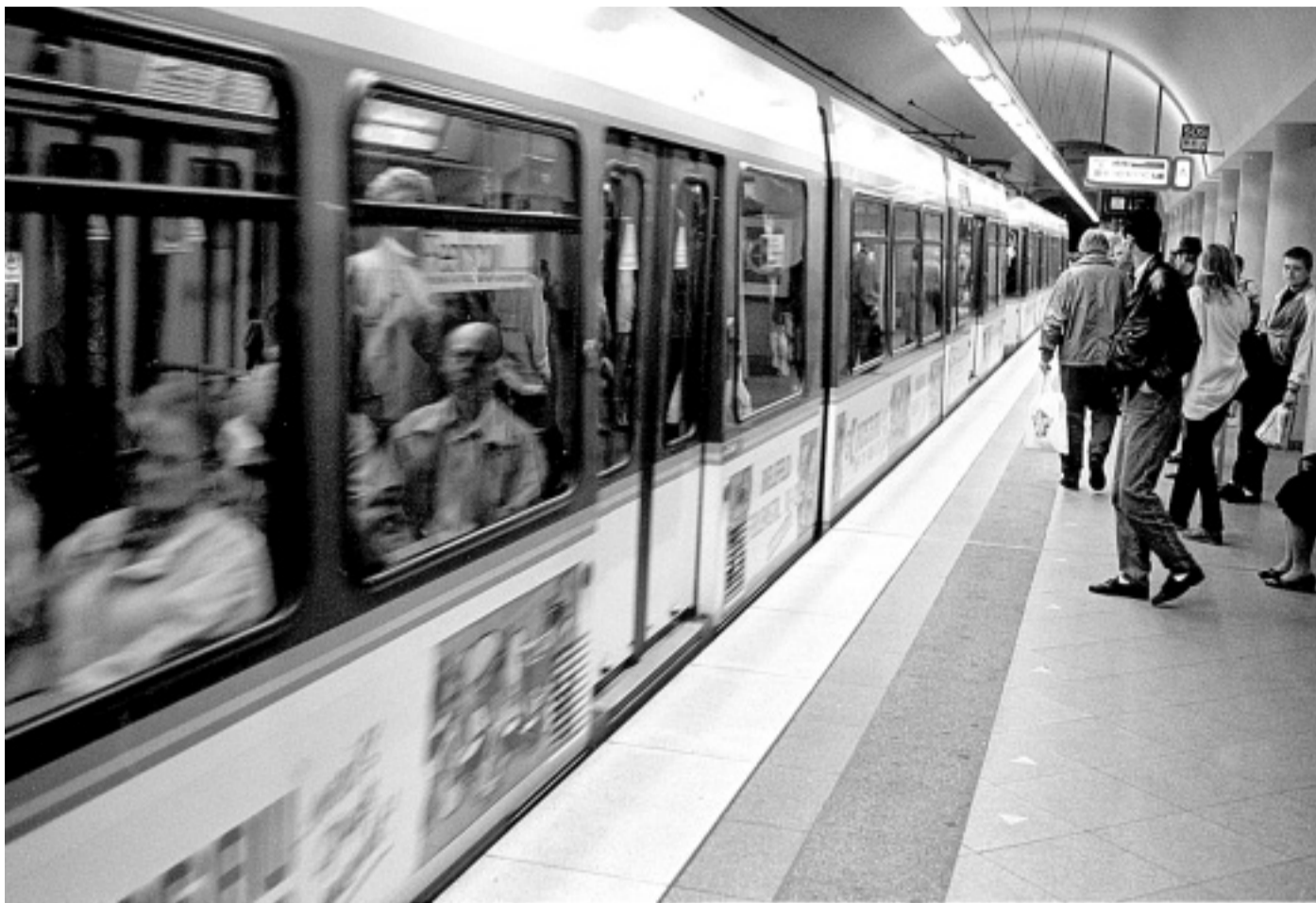
Auf flottem Erfolgskurs: Stadtbahnen und Stadtbusse transportieren seit den 60er Jahren von Jahr zu Jahr mehr Fahrgäste. Und die sind von Jahr zu Jahr zufriedener mit den Dienstleistungen, hat der Stadtwerke-Verkehrsbetrieb MoBiel ermitteln lassen.

Im vergangenen Jahr hat MoBiel beim bundesweiten Kundenbarometer des Öffentlichen Personennahverkehrs (ÖPNV) erstmals den Spitzenplatz beim Kriterium „Gesamtzufrieden-